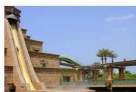
АКВАПАРК АКВАВЕНЧЕР (Атлантик) Экскурсия в ОАЭ