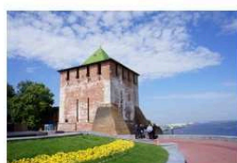
"Живая" встреча в Нижнем Новгороде 27-28 июня 2015 года Запись сообщества