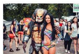
Фестиваль современных технологий, науки и искусств "GEEK PICNIC 2015" Событие